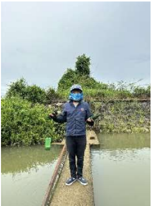
Hình 4. Trạm bơm Bích Bắc