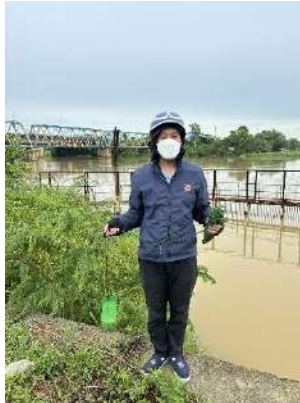
Hình 2. Thượng lưu Nhà máy nước Cầu Đỏ