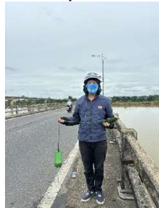
Hình 6. Cầu Câu Lâu cũ