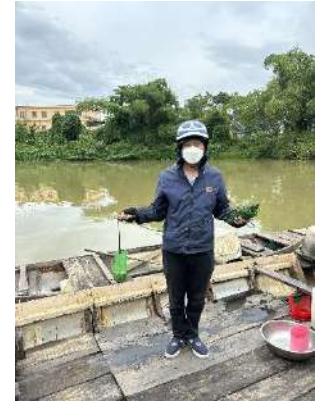
Hình 3. Trạm bơm Túy Loan