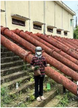
Hình 5. Trạm bơm Đông Quang