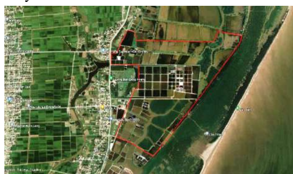
Hình 1: Hiện trạng NTTS tại xã Đông Hoàng huyện Tiền Hải, tỉnh Thái Bình

Theo Niên giám thống kê tỉnh Thái Bình tổng diện tích nuôi trồng thủy sản tại tỉnh Thái Bình khoảng 15.268 ha (2021). Trong giai đoạn gần 10 năm qua diện tích nuôi trồng thủy sản trong toàn tỉnh đã tăng lên một cách rõ rệt, từ 2012 - 2018, diện tích nuôi dưới 15.000 ha, tuy nhiên sau 2018 đặc biệt năm 2020 diện tích nuôi trồng thủy sản ghi nhận đạt cao nhất với 16.114 ha [10,11]. Tại đây đã và đang chuyển đổi một số lớn diện tích làm muối, trồng lúa được đánh giá là kém hiệu quả sang nuôi trồng thủy sản nước mặn, lợ, trở thành ngành kinh tế mũi nhọn, đặc biệt tại hai huyện ven biển Thái Thụy và Tiền Hải, chiếm tới 26%-33% toàn tỉnh, do ưu thế điều kiện tự nhiên tại đây rất thuận lợi cho sự phát triển ngành nuôi trồng thủy sản.