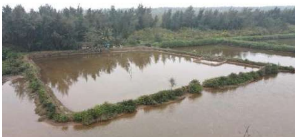
Hình 2: Hiện trạng hệ thực vật quanh đầm NTTS tại xã Đông Hoàng, huyện Tiền Hải, tỉnh Thái Bình

Kết quả điều tra khảo sát cho thấy hầu hết diện tích xã Đông Hoàng được chuyển đổi sang mục đích khoanh nuôi tạo các đầm, ao nuôi trồng thủy sản lớn nhỏ (hình 1), diện tích và thành phần loài cây ngập mặn còn lại trong khu vực nuôi trồng thủy sản còn khá thưa thớt, không bắt gặp các nhóm cây ngập mặn thực thụ, chỉ bắt gặp một số nhóm cây tham gia ngập mặn tiêu biểu thuộc các họ như Ráng, Phi lao, Ô rô, Rau đắng đất, Dền, Chua me, Dứa dại, Lạc tiên, Diệp hạ châu, Cà, Cúc... (hình 2) chúng cũng có vai trò cố định, be quanh bờ đầm, ao [12].