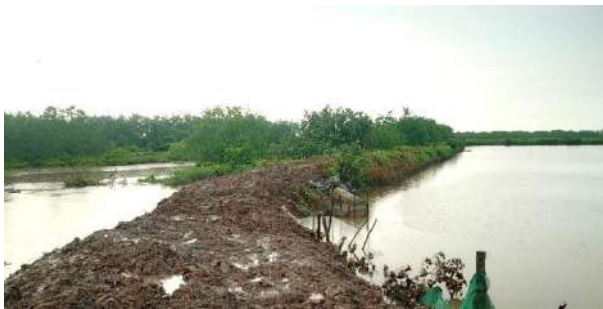
Hình 3: Hiện trạng sạt lở bờ đầm NTTS do dòng chảy tại xã Đông Hoàng, huyện Tiền Hải, tỉnh Thái Bình

Diện tích RNM trong đầm NTTS bị ảnh hưởng bởi sự thay đổi mục đích sử dụng rừng sang làm NTTS là yếu tố chính.