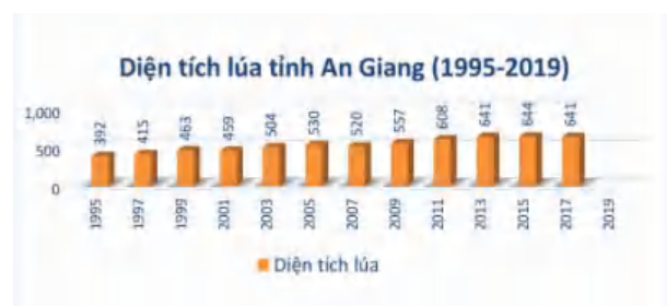
Hình 4: Biểu đồ gia tăng diện tích lúa tỉnh An Giang [10]

và ngoài nước. Trong đó, sản phẩm lúa gạo và thủy sản nước ngọt của tỉnh vươn lên đứng đầu cả nước. Xem một số biểu đồ gia tăng diện tích lúa (hình 4), sản lượng lúa (hình 5), thủy sản nước ngọt (hình 6). Số liệu lấy từ Trung tâm thống kê quốc gia [10].