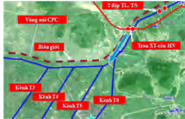
Hình 3: Một số hạng mục công trình chính tại vùng TGLX thuộc dự án thoát lũ ra biển Tây

quyết. Vào ngày 4-10-1999, lũ tại Tân Châu ở mức báo động 3, nhưng phần lớn vùng TGLX vẫn khô nước, việc học hành, đi lại vẫn bình thường như không có lũ lớn xảy ra [5].