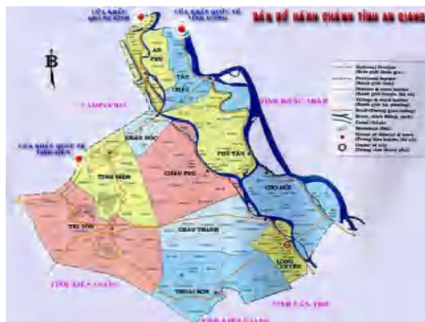
Hình 1: Phạm vi nghiên cứu toàn bộ tỉnh An Giang

Phú, Châu Thành, Châu Phú, Chợ Mới, Phú Tân, Thoại Sơn, Tri Tôn, Tịnh Biên. Trong đó, 4 huyện: An Phú, Phú Tân, Chợ Mới và thị xã Tân Châu, nằm phía bờ tả sông Hậu, còn lại nằm phía bờ hữu sông Hậu, thuộc vùng TGLX [1], hình 1.