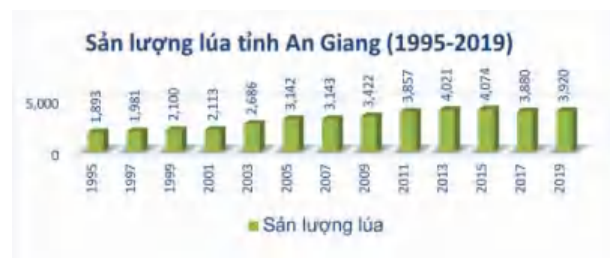
Hình 5: Biểu đồ gia tăng sản lượng lúa tỉnh An Giang [10]