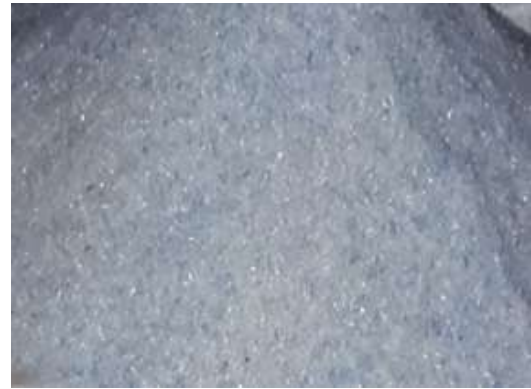
Hình 1: Cốt liệu nhựa PET tái chế nghiền mịn

* Cốt liệu nhựa PET tái chế: Trong thí nghiệm sử dụng một phần cốt liệu nhựa PET tái chế để thay thế cát tự nhiên. Nhựa PET được tái chế từ các vỏ chai nước uống, sau khi rửa sạch và phơi khô thì đem nghiền mịn như các hạt cát. Kết quả thí nghiệm nhựa PET dùng chế tạo bê tông có các chỉ tiêu cơ lý phù hợp ISO 13636:2012 trình bày trong Bảng 7. Thành phần hạt của cốt liệu nhựa PET phù hợp TCVN 7570:2006 như trong Bảng 8.