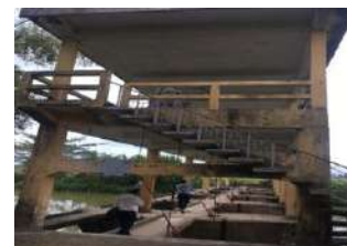
Hình 4. Đập dâng Thanh Quyết