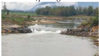
Hình 6. Đập tạm Quảng Huế