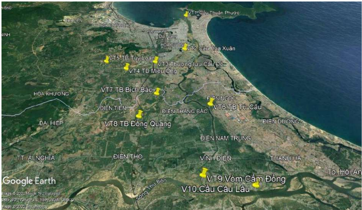
Hình 1. Vị trí các điểm quan trắc trong hệ thống thủy lợi An Trạch