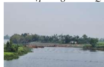
Hình 7. Đập tạm Tứ Câu