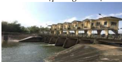
Hình 5. Đập dâng Bàu Nít