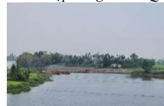
Hình 9. Đập tạm Tứ Câu