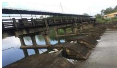
Hình 5. Đập dâng Hà Thanh