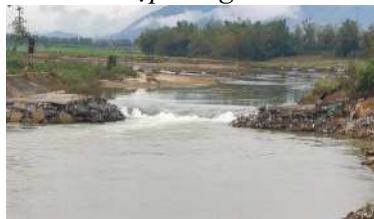
Hình 8. Đập tạm Quảng Huế