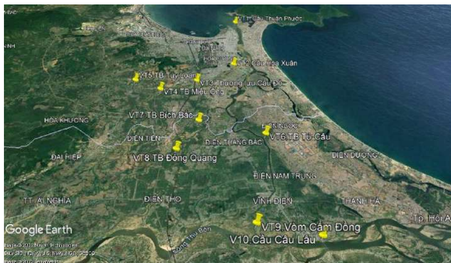
Hình 1. Vị trí các điểm quan trắc trong hệ thống thủy lợi An Trạch