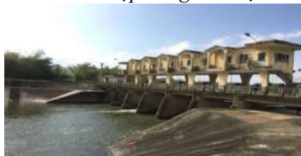
Hình 7. Đập dâng Bàu Nít