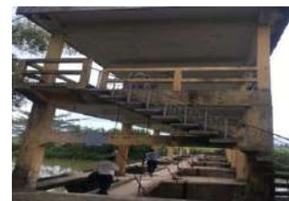
Hình 6. Đập dâng Thanh Quýt