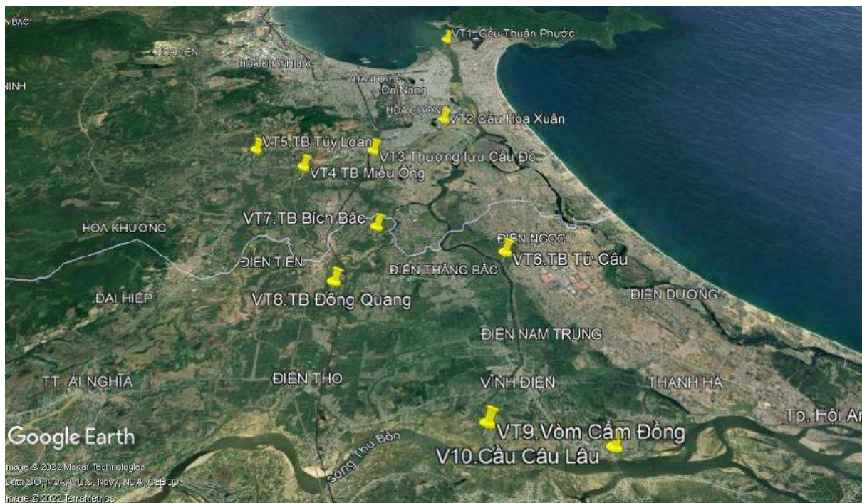
Hình 1. Vị trí các điểm quan trắc trong hệ thống thủy lợi An Trạch