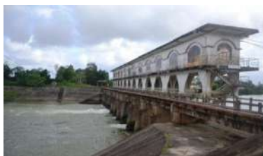
Hình 2. Đập dâng An Trạch

Một số hình ảnh các đập dâng, đập tạm ngăn mặn trên hệ thống Vu Gia - Thu Bồn