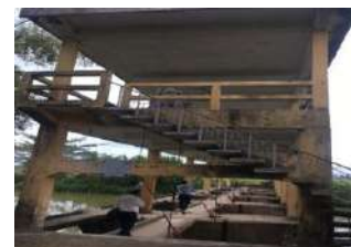
Hình 4. Đập dâng Thanh Quýt