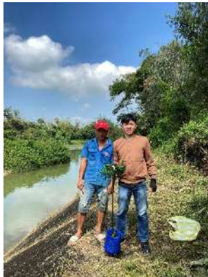
Hình 4. Trạm bơm Đông Quang