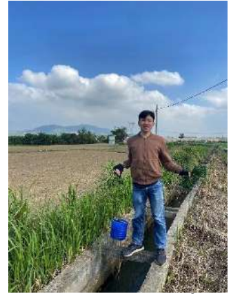
Hình 3. Trạm bơm Miếu Ông