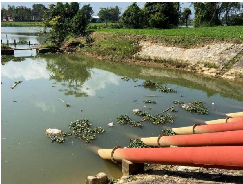
Hình 7. Hình ảnh rác thải và bèo tây nổi lên trên mặt nước tại TB Tứ Câu

Ngoài ra, dựa theo số liệu quan trắc hiện trường và đánh giá cảm quan của nhóm thực hiện nhiệm vụ thì nguồn nước tại VT1- Cầu Thuận Phước, VT5-TB Túy Loan và VT6- TB Tứ Câu có màu đục và có mùi hôi/tanh hơn so với các vị trí còn lại. Trong đó, độ đục tại VT5-TB Túy Loan có giá trị cao nhất (đạt 61 NTU), nguồn nước tại vị trí này có mùi hôi/tanh của bùn đất; tại VT1- cầu Thuận Phước giá trị độ đục đo được là 22,79NTU và nguồn nước có mùi hôi của rác thải; tại VT6-TB Tứ Câu tình trạng bèo tây và rác thải nổi trên mặt nước là nguyên nhân khiến cho nguồn nước tại vị trí này có mùi hôi khá nặng so với 2 vị trí trên, giá trị độ đục đo được là 20,5NTU.