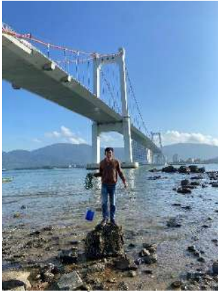
Hình 1. Cầu Thuận Phước

Một số hình ảnh lấy mẫu hiện trường ngày 01/02/2024 tại các vị trí quan trắc: