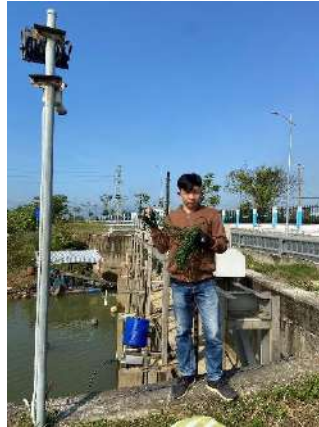
Hình 2. Thượng lưu Cầu Đỏ