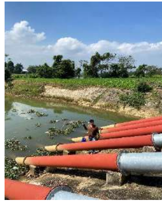
Hình 5. Trạm bơm Tứ Cầu