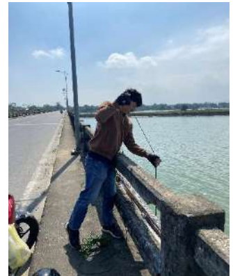
Hình 6. Cầu Câu Lâu