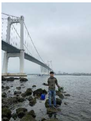
Hình 1. Cầu Thuận Phước

Một số hình ảnh lấy mẫu hiện trường ngày 21/02/2024 tại các vị trí quan trắc: