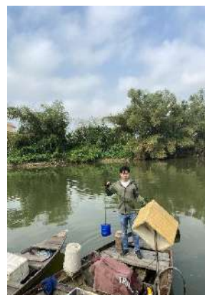
Hình 3. Trạm bơm Túy Loan