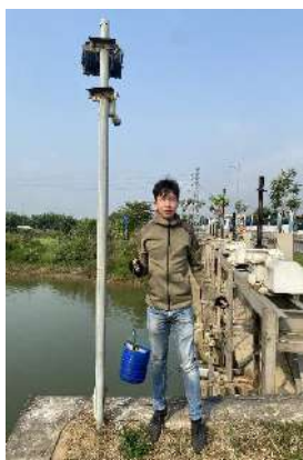
Hình 2. Cầu Đò