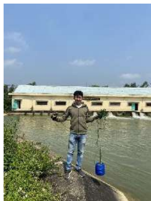
Hình 4. Trạm bơm Đông Quang