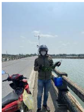
Hình 5. Cầu Câu Lâu