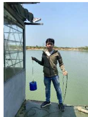
Hình 6. Vòm Cẩm Đồng