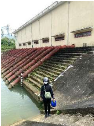
Hình 4. Trạm bơm Đông Quang