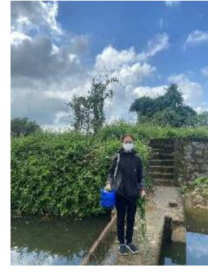
Hình 3. Trạm bơm Bích Bắc