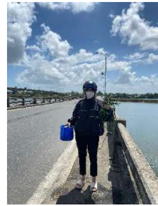
Hình 6. Cầu Câu Lâu