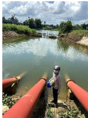
Hình 5. Trạm bơm Tứ Cầu