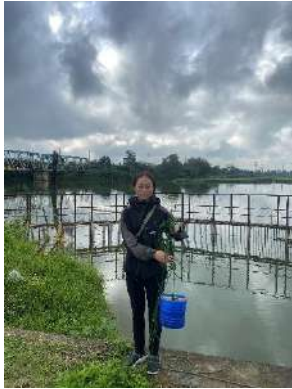
Hình 1. Cầu Đò

Một số hình ảnh lấy mẫu hiện trường ngày 28/02/2024 tại các vị trí quan trắc: