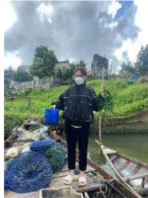
Hình 2. Trạm bơm Túy Loan