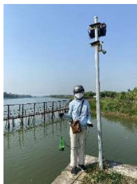
Hình 2. Thượng lưu NMN Cầu Đỏ