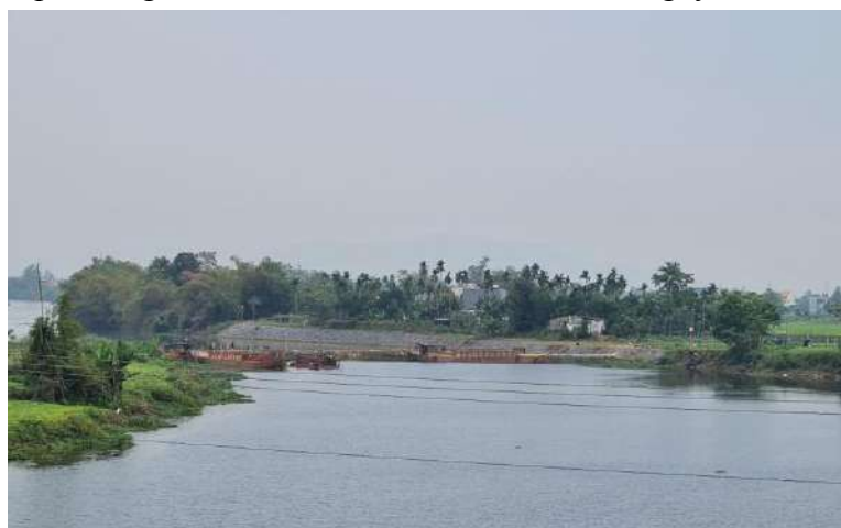
Hình 7. Công trình đập tạm Tứ Câu đã hoàn thiện

Tại khu vực nghiên cứu có hệ thống các đập dâng An Trạch, Hà Thanh, Bàu Nít, Thanh Quýt và đập ngăn mặn Duy Thành đã được xây dựng kiên cố. Ngoài ra, trên sông Quảng Huế, năm 2021 đã tiến hành xây dựng 01 đập tạm dâng nước trên sông, tuy nhiên đập tạm đã bị xói lở nhiều sau trận mưa lũ lớn năm 2022 chưa được nâng cấp, sửa chữa. Trên nhánh sông Vĩnh Điện, công trình đập tạm ngăn mặn Tứ Câu đã hoàn thiện vào ngày 06/3/2024.