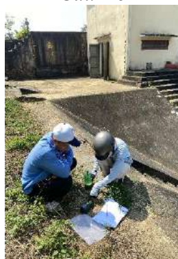
Hình 5. Trạm bơm Đông Quang