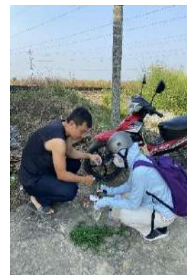
Hình 6. Trạm bơm Từ Cầu