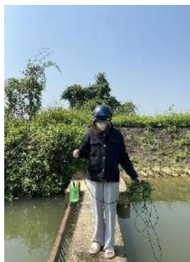
Hình 4. Trạm bơm Bích Bắc