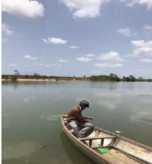
Hình 4. Vòm Cẩm Đồng