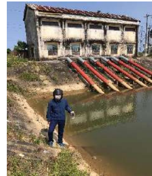
Hình 3: Trạm bơm Tứ Cầu