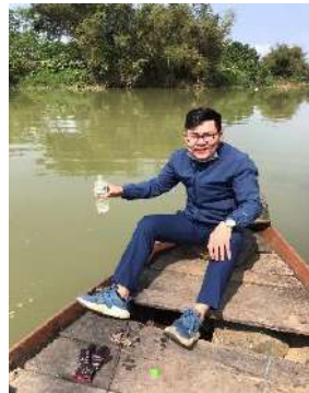
Hình 2: Trạm bơm Tuý Loan