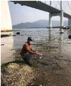
Hình 1: Cầu Thuận Phước

Một số hình ảnh lấy mẫu hiện trường ngày 08/3/2023 tại các vị trí quan trắc: