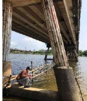
Hình 5. Cầu Câu Lâu