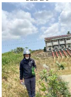
Hình 5. Trạm bơm Tứ Cầu