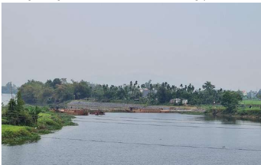
Hình 7. Công trình đập tạm Tứ Câu đã hoàn thiện

Tại khu vực nghiên cứu có hệ thống các đập dâng An Trạch, Hà Thanh, Bàu Nít, Thanh Quýt và đập ngăn mặn Duy Thành đã được xây dựng kiên cố. Ngoài ra, trên sông Quảng Huế, năm 2021 đã tiến hành xây dựng 01 đập tạm dâng nước trên sông, tuy nhiên đập tạm đã bị xói lở nhiều sau trận mưa lũ lớn năm 2022 chưa được nâng cấp, sửa chữa. Trên nhánh sông Vĩnh Điện, công trình đập tạm ngăn mặn Tứ Câu đã hoàn thiện vào ngày 06/3/2024.