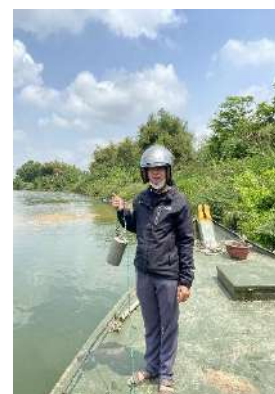
Hình 6. Vòm Cẩm Đồng