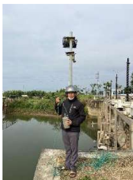
Hình 2. Thượng lưu NMN Cầu Đỏ