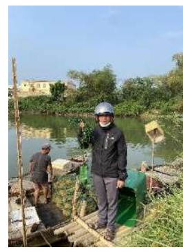
Hình 3. Trạm bơm Túy Loan