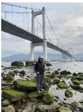
Hình 1. Cầu Thuận Phước

Một số hình ảnh lấy mẫu hiện trường ngày 13/03/2024 tại các vị trí quan trắc: