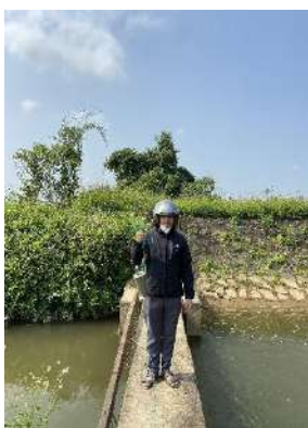
Hình 4. Trạm bơm Bích Bắc