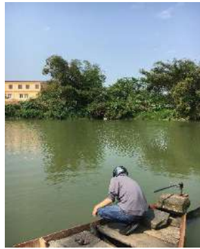
Hình 2: Trạm bơm Túy Loan