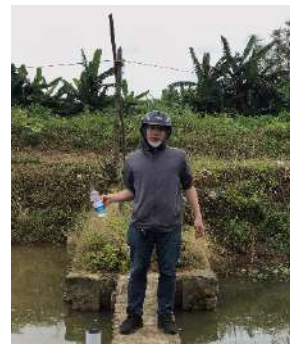
Hình 5: Trạm bơm Tứ Cầu