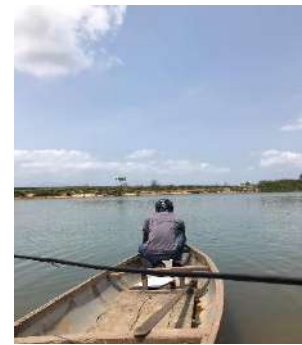
Hình 6: Vòm Cẩm Đồng