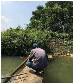
Hình 4: Trạm bơm Bích Bắc