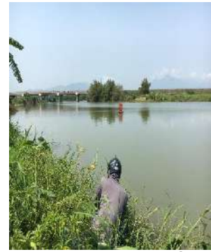
Hình 3: Trạm bơm Miếu Ông