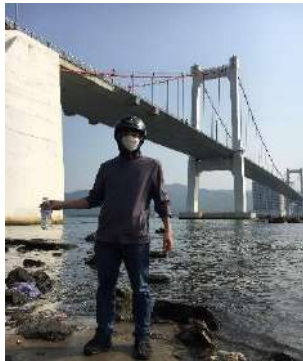
Hình 1: Cầu Thuận Phước

Một số hình ảnh lấy mẫu hiện trường ngày 15/3/2023 tại các vị trí quan trắc: