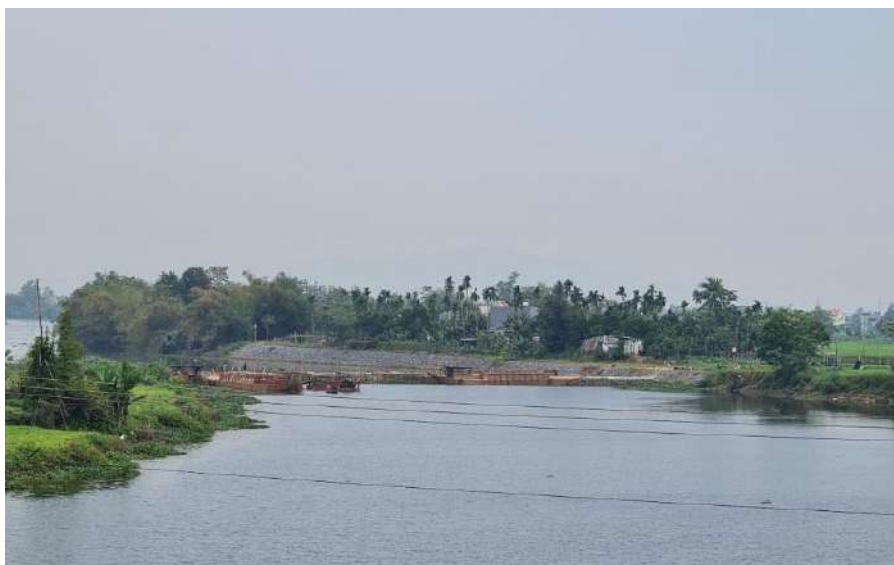
Hình 7. Công trình đập tạm Tứ Câu đã hoàn thiện

Tại khu vực nghiên cứu có hệ thống các đập dâng An Trạch, Hà Thanh, Bàu Nít, Thanh Quýt và đập ngăn mặn Duy Thành đã được xây dựng kiên cố. Trên sông Quảng Huế có 01 đập tạm dâng nước trên sông, tuy nhiên đập tạm đã bị xói lở nhiều sau trận mưa lũ lớn năm 2022 chưa được nâng cấp, sửa chữa. Trên nhánh sông Vĩnh Điện, công trình đập tạm ngăn mặn Tứ Câu đã hoàn thiện vào ngày 06/3/2024.