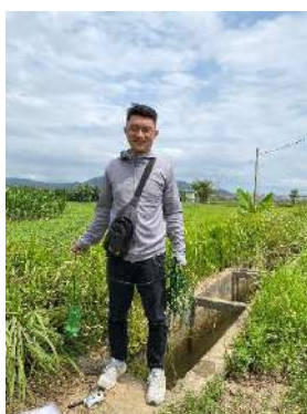
Hình 4. Trạm bơm Miếu Ông