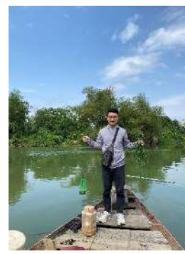
Hình 3. Trạm bơm Túy Loan Cầu Đỏ