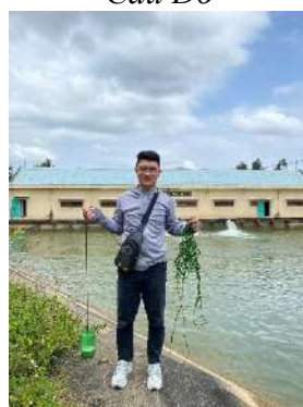
Hình 5. Trạm bơm Đông Quang