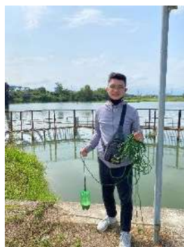
Hình 2. Thượng lưu NMN Cầu Đỏ