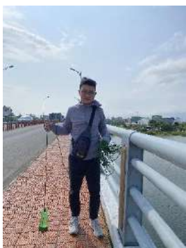
Hình 1. Cầu Hòa Xuân

Một số hình ảnh lấy mẫu hiện trường ngày 20/03/2024 tại các vị trí quan trắc: