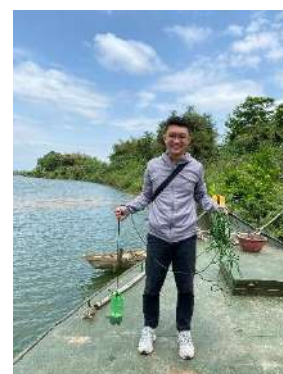
Hình 6. Vòm Cẩm Đông