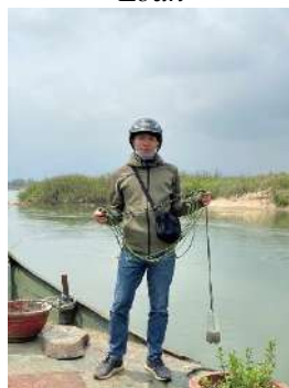
Hình 5. Vòm Cẩm Đồng