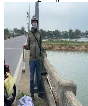
Hình 6. Cầu Câu Lâu