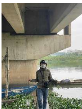
Hình 1. Cầu Hoà Xuân

Một số hình ảnh lấy mẫu hiện trường ngày 29/3/2023 tại các vị trí quan trắc: