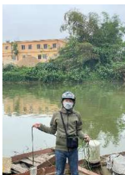
Hình 2. Trạm bơm Túy Loan