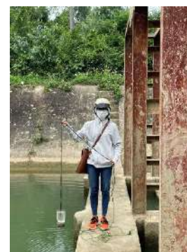
Hình 3. Trạm bơm Đông Quang