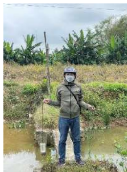
Hình 3. Trạm bơm Tứ Cầu