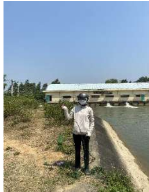
Hình 5. Trạm bơm Đông Quang