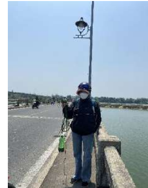
Hình 6. Cầu Câu Lâu