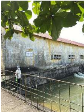
Hình 4. Trạm bơm Bích Bắc