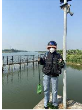
Hình 2. Thợ lưu NMN Cầu Đỏ