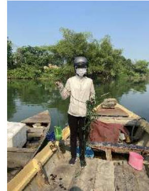
Hình 3. Trạm bơm Tuý Loan