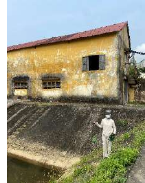
Hình 3. Trạm bơm Bích Bắc