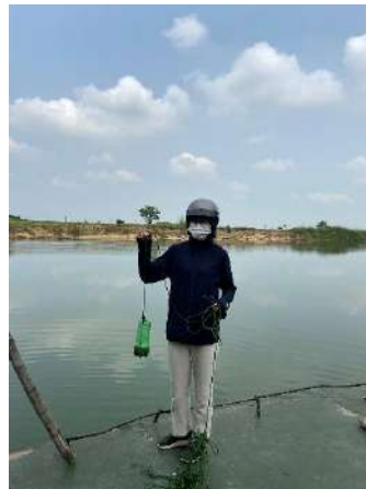
Hình 5. Vòm Cắm Đồng