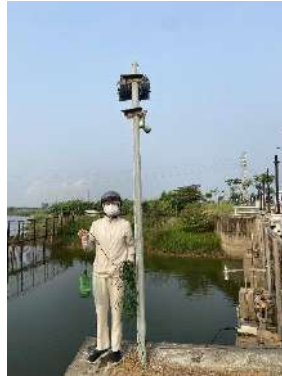
Hình 2. Thượng lưu NMN Cầu Đỏ