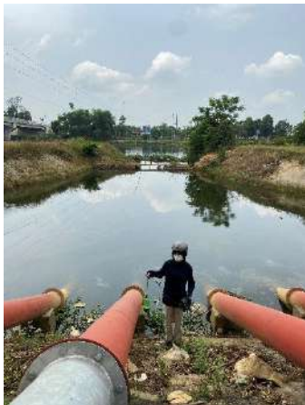
Hình 4. Trạm bơm Tứ Cầu