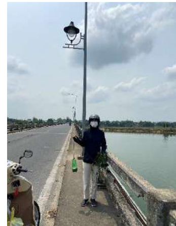
Hình 6. Cầu Câu Lâu