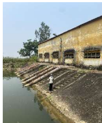
Hình 5. Trạm bơm Bích Bắc