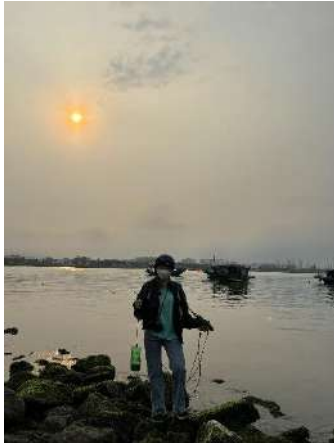
Hình 1. Cầu Thuận Phước

Một số hình ảnh lấy mẫu hiện trường ngày 24/04/2024 tại các vị trí quan trắc: