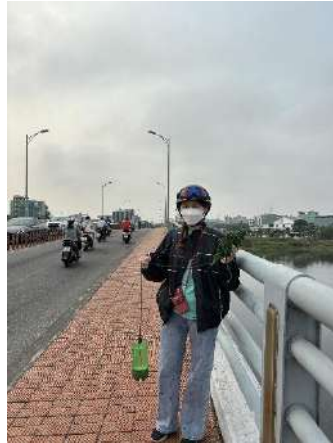
Hình 2. Cầu Hoà Xuân