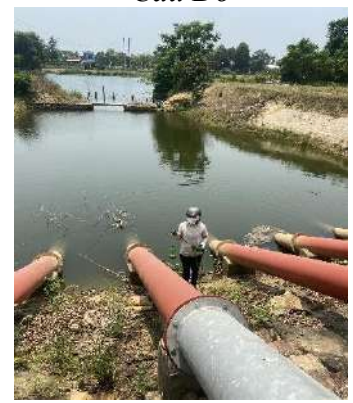
Hình 6. Trạm bơm Từ Cầu