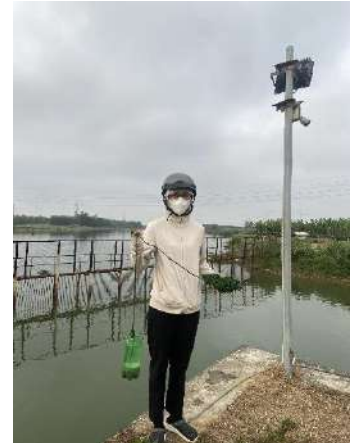
Hình 3. Thượng lưu NMN Cầu Đỏ