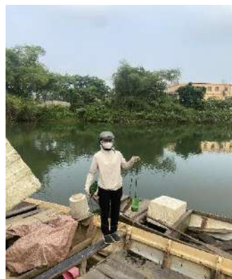
Hình 4. Trạm bơm Tuý Loan