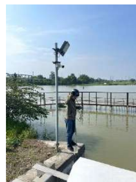
Hình 3. Cầu Đò