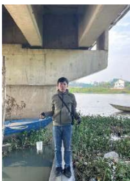
Hình 2. Cầu Hoà Xuân