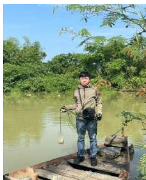
Hình 4. Trạm bơm Túy Loan