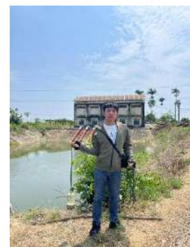
Hình 6. Trạm bơm Tứ Cầu