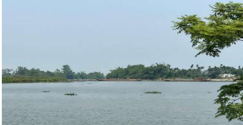
Hình 7. Công trình đập tạm Tứ Câu đã hoàn thiện