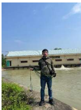
Hình 5. Trạm bơm Đông Quang