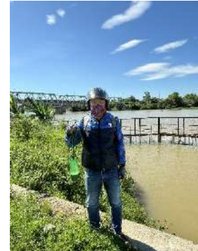
Hình 3. Thương lưu Nhà máy nước Cầu Đổ