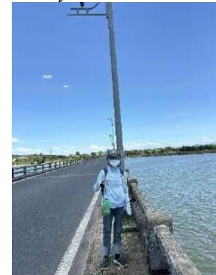
Hình 6. Cầu Câu Lâu