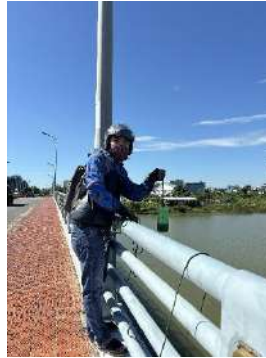
Hình 2. Cầu Hòa Xuân