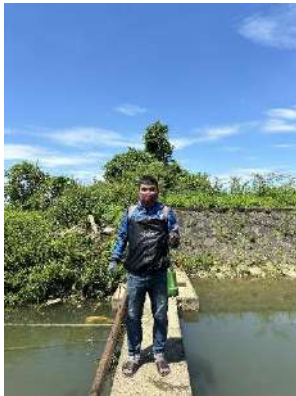
Hình 4. Trạm bơm Bích Bắc