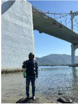
Hình 1. Cầu Thuận Phước

Một số hình ảnh lấy mẫu hiện trường ngày 12/06/2024 tại các vị trí quan trắc: