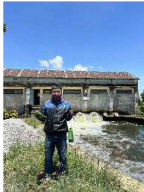
Hình 5. Trạm bơm Từ Cầu