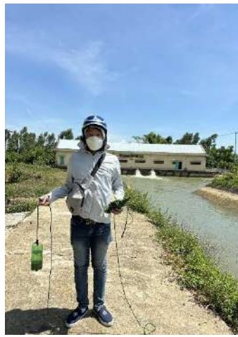
Hình 5. Trạm bơm Đông Quang