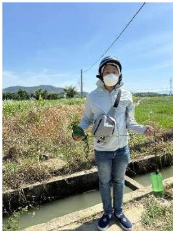
Hình 4. Trạm bơm Miếu Ông