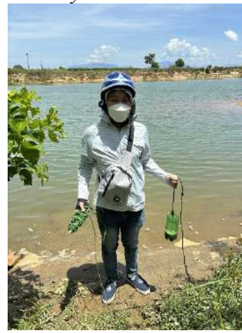
Hình 6. Vòm Cẩm Đồng