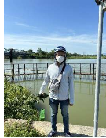
Hình 3. Thượng lưu Nhà máy nước Cầu Đỏ