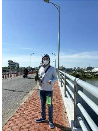
Hình 2. Cầu Hòa Xuân