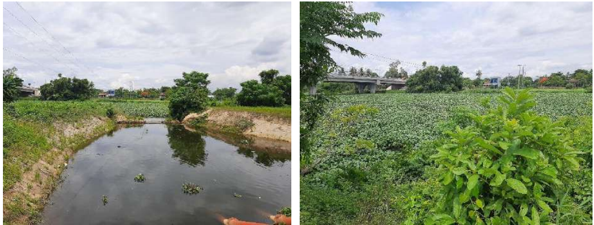
Hình 7. Mặt nước sông Vĩnh Điện tại khu vực Trạm bơm Tứ Cầu bị bao phủ kín bởi bèo lục bình

QCVN08-MT:2023/BTNMT. Bên cạnh đó, tại thời điểm quan trắc nguồn nước sông Vĩnh Điện tại khu vực trạm bơm Tứ Cầu bị bao phủ kín bởi bèo lục bình, đây có thể là một trong những nguyên nhân làm suy giảm oxy do hạn chế trao đổi khí khiến cho hàm lượng oxy hòa tan (DO) tại vị trí này bị suy giảm.