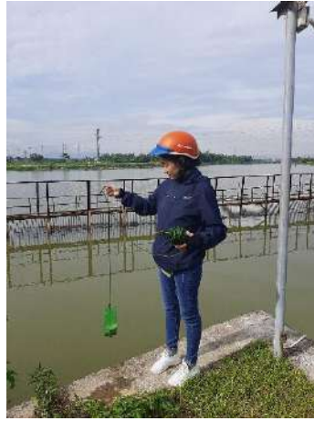
Hình 2. Thượng lưu Nhà máy nước Cầu Đỏ