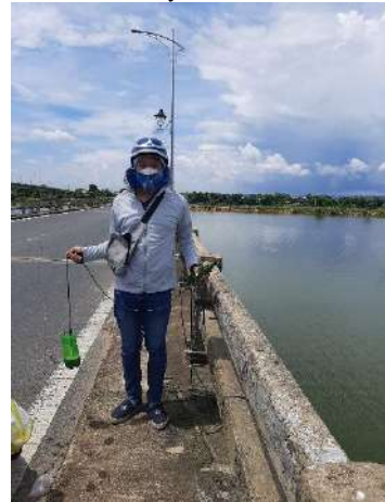
Hình 6. Cầu Câu Lâu