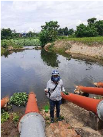
Hình 4. Trạm bơm Tứ Cầu