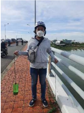
Hình 1. Cầu Hòa Xuân

Một số hình ảnh lấy mẫu hiện trường ngày 26/06/2024 tại các vị trí quan trắc: