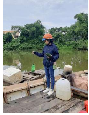
Hình 3. Trạm bơm Túy Loan