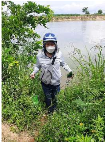
Hình 5. Vòm Cắm Đồng