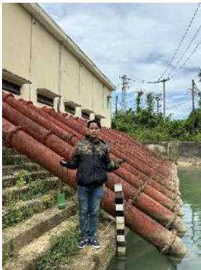
Hình 4. Trạm bơm Đông Quang