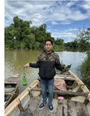
Hình 3. Trạm bơm Túy Loan