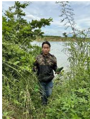
Hình 5. Vòm Cẩm Đồng