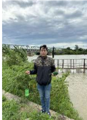
Hình 2. Thượng lưu Nhà máy nước Cầu Đỏ