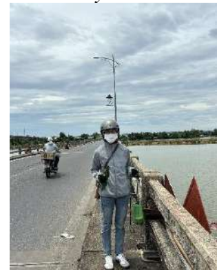
Hình 6. Cầu Câu Lâu cũ