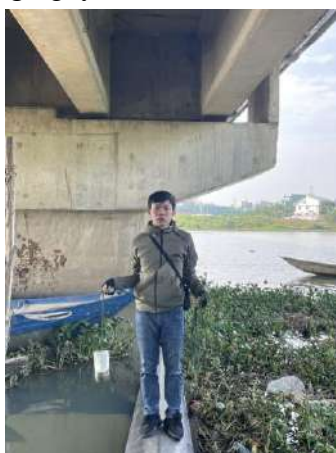
Hình 2. Cầu Hòa Xuân