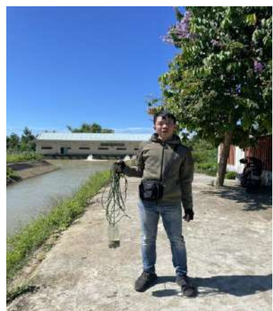
Hình 4. Trạm bơm Đông Quang