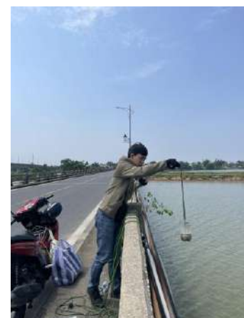
Hình 6. Cầu Câu Lâu