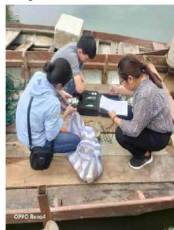
Hình 3. Trạm bơm Túy Loan