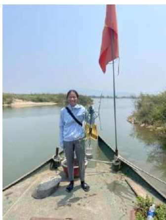
Hình 5. Vòm Cẩm Đông