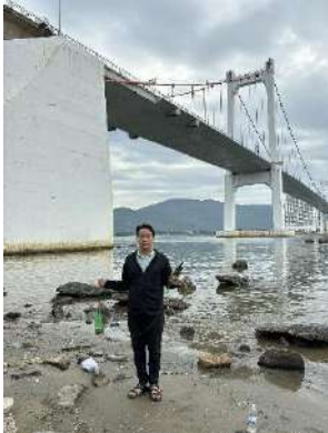
Hình 1. Cầu Thuận Phước

Một số hình ảnh lấy mẫu hiện trường ngày 31/07/2024 tại các vị trí quan trắc: