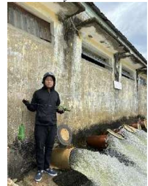
Hình 6. Trạm bơm Tứ Cầu