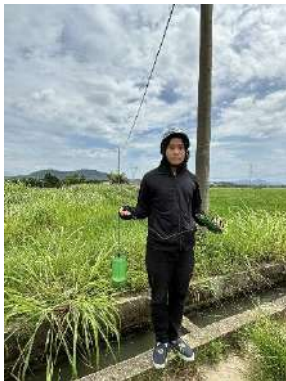
Hình 4. Trạm bơm Miếu Ông