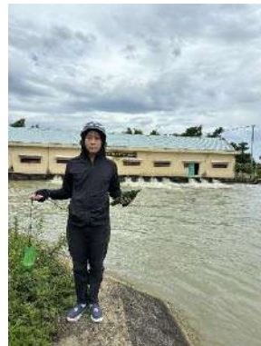
Hình 5. Trạm bơm Đông Quang