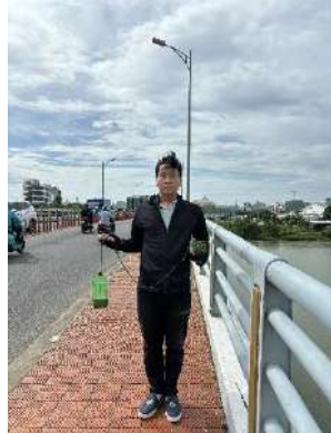
Hình 2. Cầu Hòa Xuân