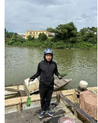
Hình 3. Trạm bơm Túc Loan