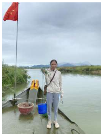
Hình 5. Vòm Cẩm Đồng