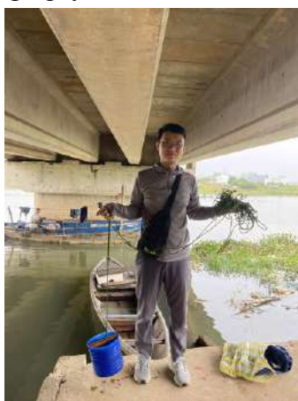
Hình 2. Cầu Hòa Xuân