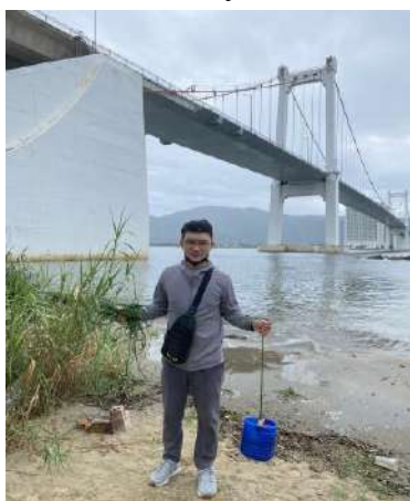
Hình 1. Cầu Thuận Phước

Một số hình ảnh lấy mẫu hiện trường ngày 02/08/2023 tại các vị trí quan trắc: