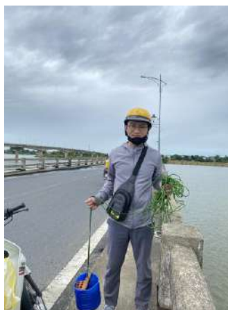
Hình 6. Cầu Câu Lâu