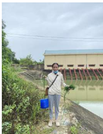
Hình 4. Trạm bơm Tír Cầu