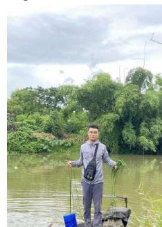
Hình 3. Trạm bơm Túy Loan