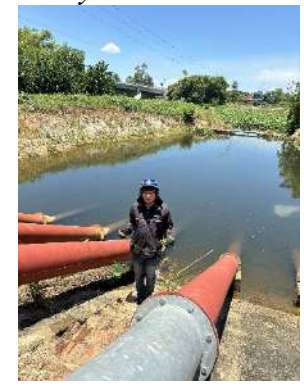
Hình 6. Trạm bơm Tứ Cầu