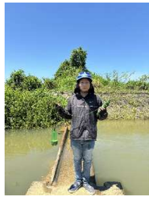
Hình 5. Trạm bơm Bích Bắc