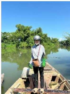
Hình 4. Trạm bơm Tủy Loan