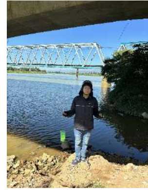
Hình 3. Thượng lưu nhà máy nước Cầu Đỏ