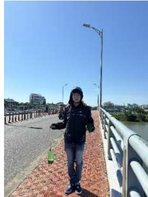
Hình 2. Cầu Hòa Xuân