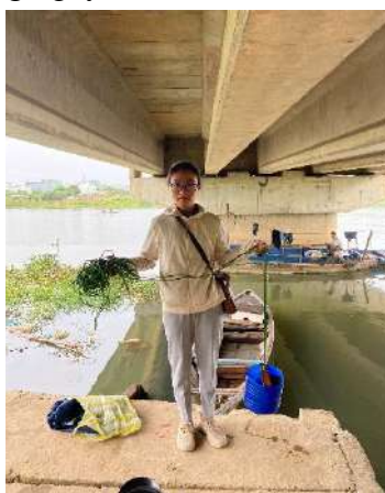
Hình 2. Cầu Hòa Xuân