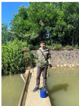
Hình 5. Trạm bơm Bích Bắc