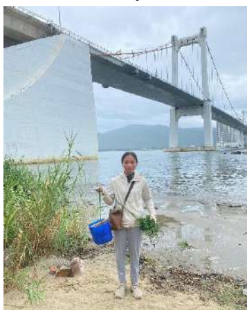
Hình 1. Cầu Thuận Phước

Một số hình ảnh lấy mẫu hiện trường ngày 09/08/2023 tại các vị trí quan trắc: