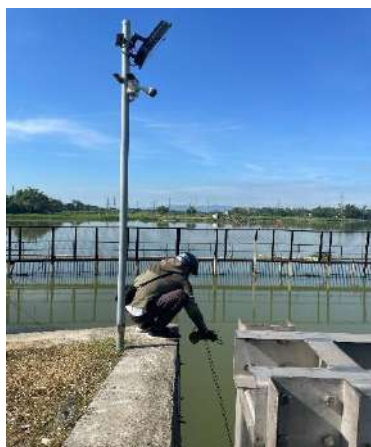
Hình 4. Thượng lưu NMN Cầu Đò