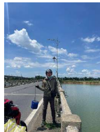
Hình 6. Cầu Câu Lâu