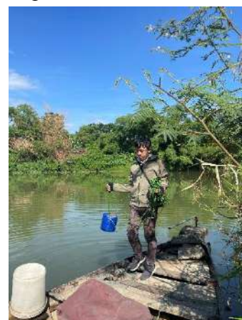
Hình 3. Trạm bơm Túy Loan