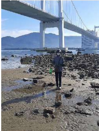
Hình 1. Cầu Thuận Phước

Một số hình ảnh lấy mẫu hiện trường ngày 14/08/2024 tại các vị trí quan trắc: