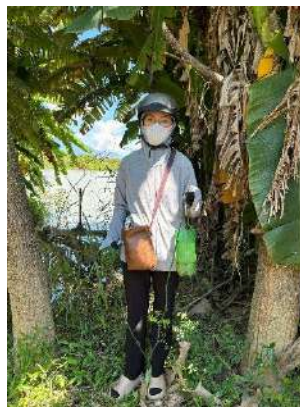
Hình 5. Trạm bơm Miếu Ông