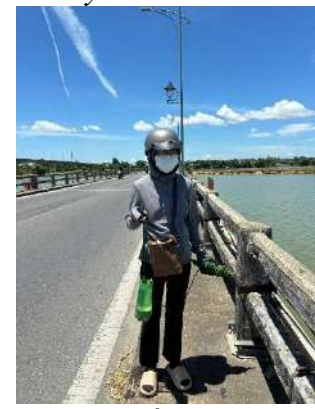
Hình 6. Cầu Câu Lâu