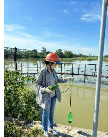
Hình 3. Thượng lưu nhà máy nước Cầu Đỏ