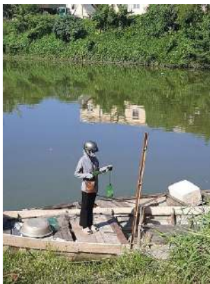
Hình 4. Trạm bơm Túy Loan