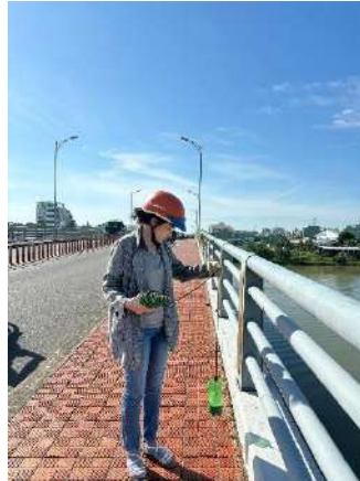
Hình 2. Cầu Hòa Xuân