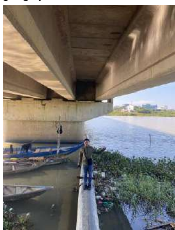
Hình 2. Cầu Hòa Xuân