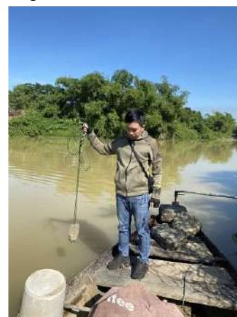
Hình 3. Trạm bơm Túy Loan