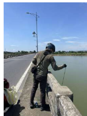
Hình 6. Cầu Câu Lâu