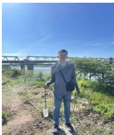
Hình 4. Thượng lưu NMN Cầu Đỏ