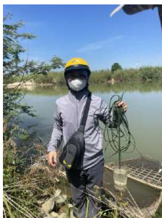
Hình 5. Vòm Cắm Đông