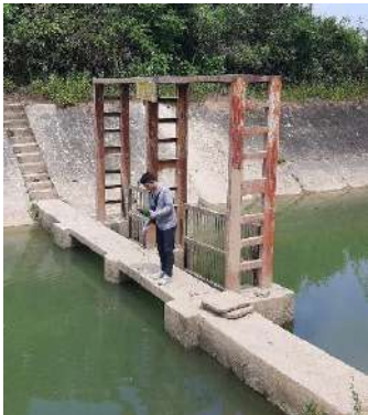
Hình 4. Trạm bơm Đông Quang