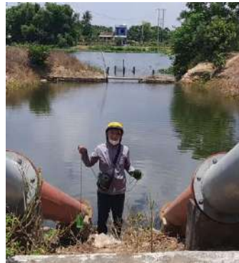
Hình 5. Trạm bơm Tứ Câu