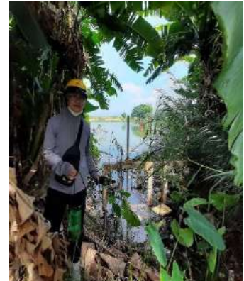
Hình 3. Trạm bơm Miếu Ông