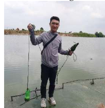
Hình 6. Vòm Cắm Đồng