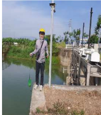
Hình 2. Thượng lưu NMN Cầu Đỏ