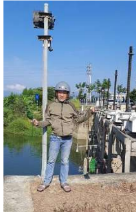
Hình 2. Thương lưu nhà máy nước Cầu Đỏ