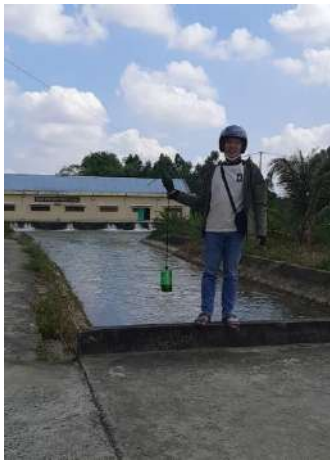
Hình 4. Trạm bơm Đông Quang