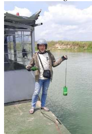
Hình 6. Vòm Cắm Đồng