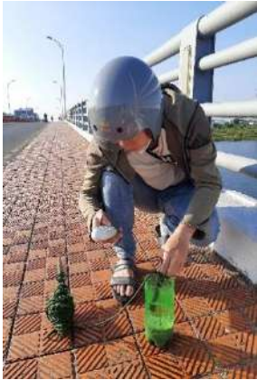
Hình 1. Cầu Hòa Xuân

Một số hình ảnh lấy mẫu hiện trường ngày 15/05/2024 tại các vị trí quan trắc: