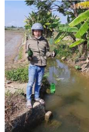
Hình 3. Trạm bơm Miếu Ông