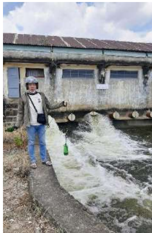
Hình 5. Trạm bơm Tứ Cầu