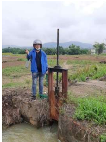
Hình 2. Trạm bơm Miếu Ông