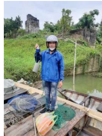
Hình 3. Trạm bơm Túy Loan