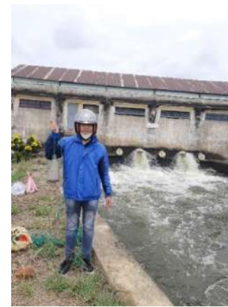
Hình 6. Trạm bơm Từ Cầu