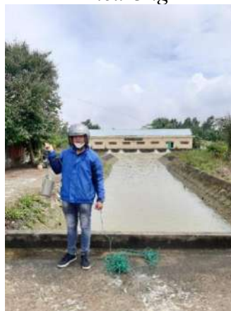
Hình 5. Trạm bơm Đông Quang