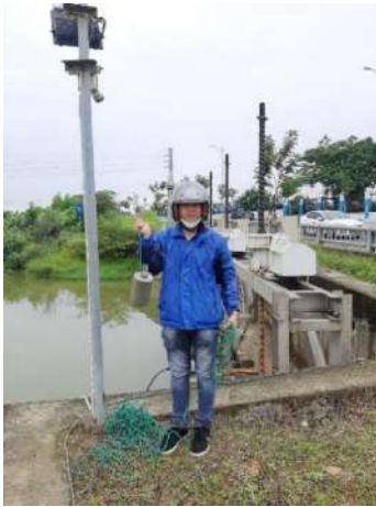
Hình 1. Thượng lưu nhà máy nước Cầu Đỏ

Một số hình ảnh lấy mẫu hiện trường ngày 22/05/2024 tại các vị trí quan trắc: