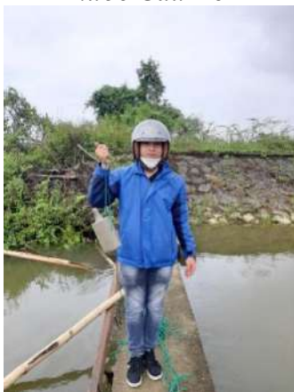
Hình 4. Trạm bơm Bích Bắc