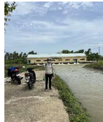
Hình 6. Trạm bơm Đông Quang