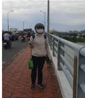
Hình 2. Cầu Hòa Xuân