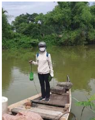
Hình 5. Trạm bơm Túy Loan