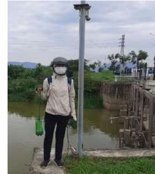
Hình 3. Thượng lưu nhà máy nước Cầu Đỏ