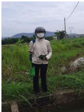
Hình 4. Trạm bơm Miếu Ông