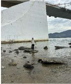
Hình 1. Chân Cầu Thuận Phước

Một số hình ảnh lấy mẫu hiện trường ngày 29/05/2024 tại các vị trí quan trắc: