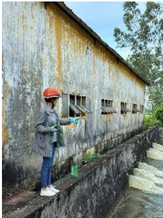
Hình 4. Trạm bơm Bích Bắc