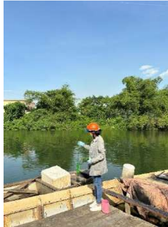
Hình 2. Trạm bơm Túy Loan