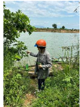
Hình 6. Vòm Cắm Đồng