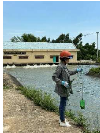
Hình 5. Trạm bơm Đông Quang