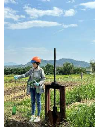
Hình 3. Trạm Bơm Miếu Ông