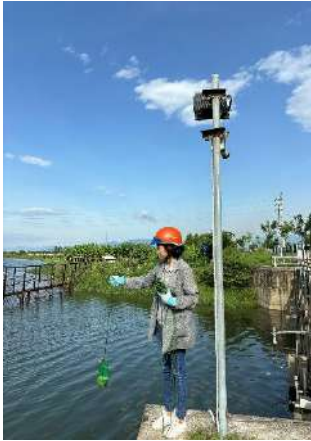
Hình 1. Cầu Đỏ

Một số hình ảnh lấy mẫu hiện trường ngày 05/06/2024 tại các vị trí quan trắc: